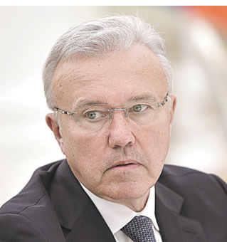
Александр Усс, губернатор Красноярского края

ИНФОГРАФИКА: РФ, МАКСИМ КРАВЧУК / ЮРИЙ ПРОКОПОВ