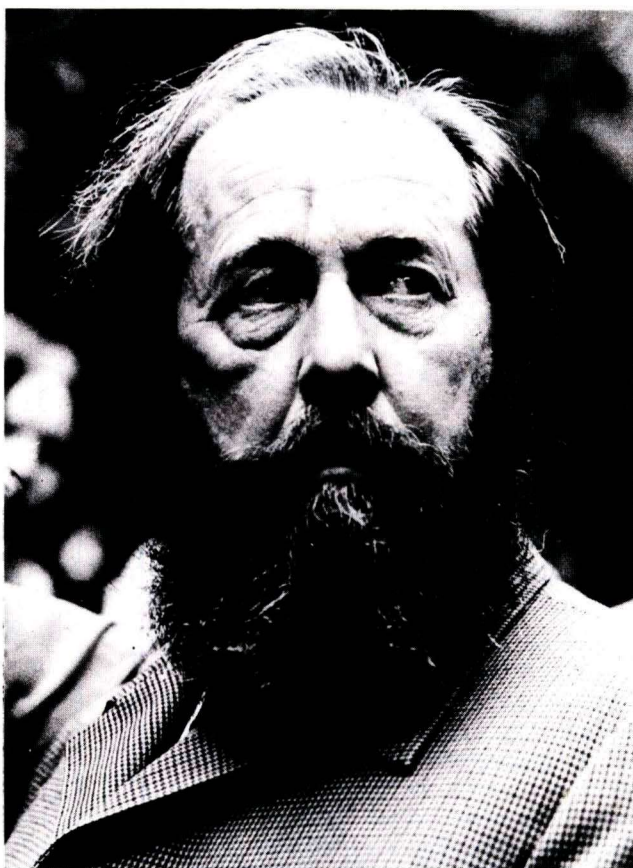
Александр Исаевич Солженицын

ЕЖЕМЕСЯЧНЫЙ ОБЩЕСТВЕННО-ПОЛИТИЧЕСКИЙ ЖУРНАЛ