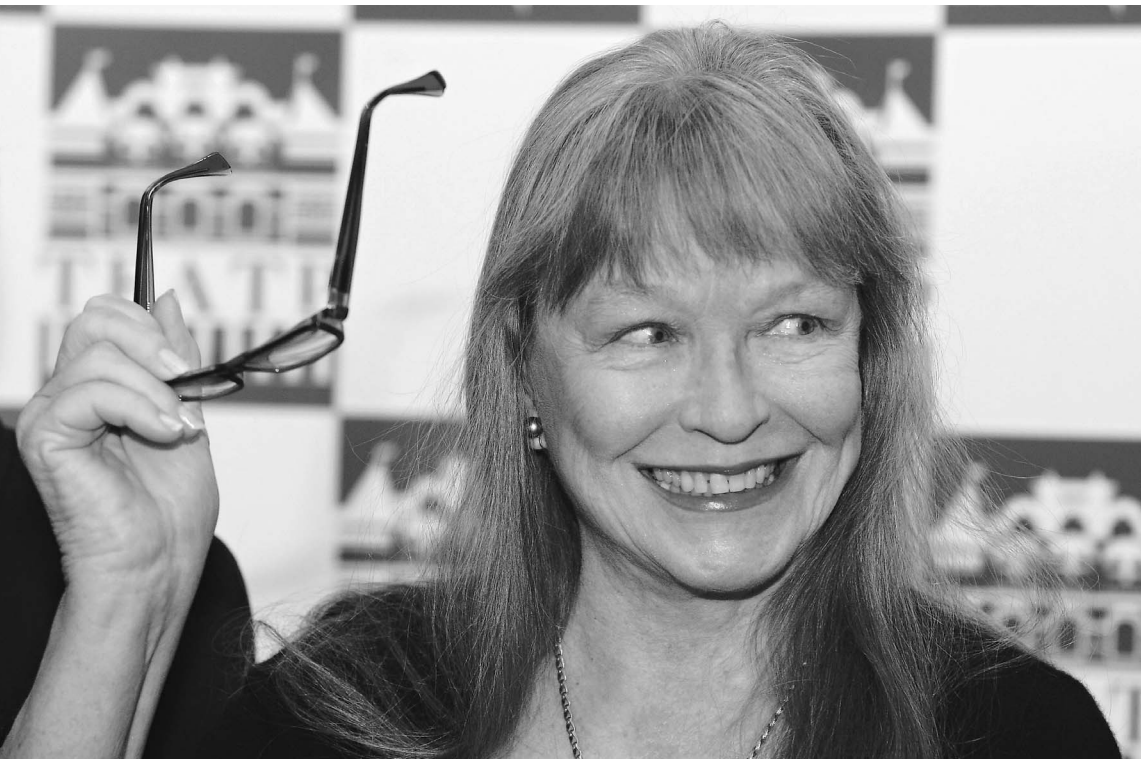
Марина Влади: моя героиня очаровательная русская баба — смешная, жизнерадостная, увлекающаяся

ОФИЦИАЛЬНЫЕ (ЦЕНТРАЛЬНЫЙ БАНК РФ) КУРСЫ ВАЛЮТ К РУБЛЮ НА 15 ОКТЯБРЯ