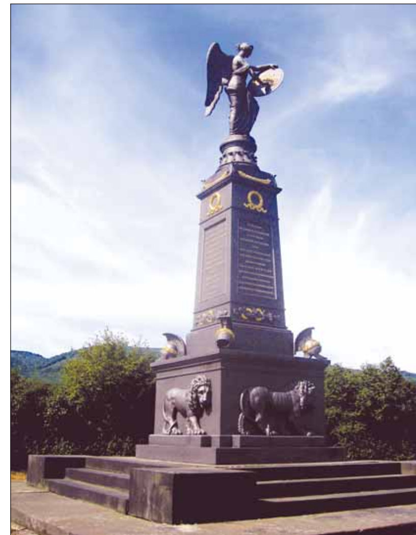
Пржестанов (бывший Пристен). Памятник русским воинам, сражавшимся при Кульме. 2013 год