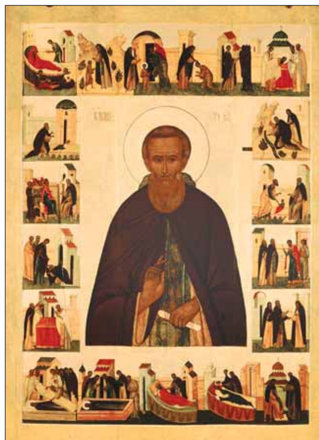
Преподобный Сергий Радонежский с житием. Москва. Дерево, паволока, левкас, темпера. Вторая четверть XVI века

700 лет назад в селе Варницы под Ростовом Великим родился будущий игумен Земли Русской — Сергий Радонежский. Эта дата имеет особое значение для всей нашей страны. По слову историка В. О. Ключевского, «при имени преподобного Сергия народ вспоминает свое нравственное возрождение, сделавшее возможным и возрождение политическое. <...> Творя память преподобного Сергия, мы проверяем самих себя, пересматриваем свой нравственный запас, завещанный нам великими строителями нашего нравственного порядка».