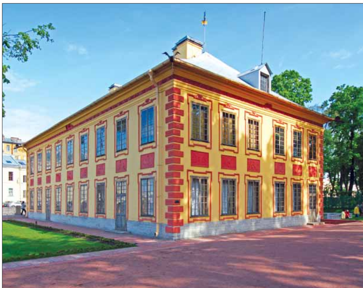
Санкт-Петербург. Летний дворец Петра I. 2012 год

О петровской резиденции в Летнем саду Санкт-Петербурга