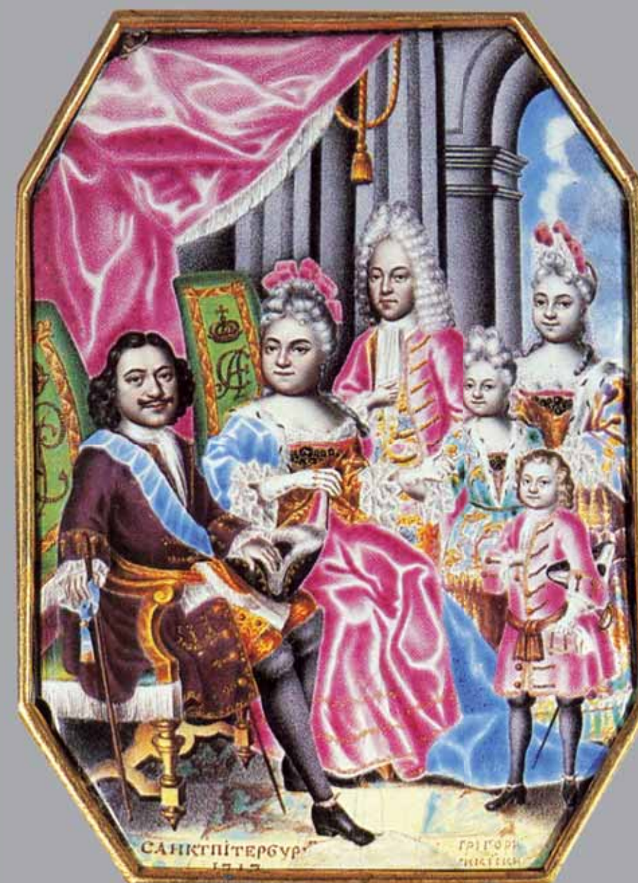
Г. С. МУСИКИЙСКИЙ. СЕМЕЙНЫЙ ПОРТРЕТ ПЕТРА I. МИНИАТЮРА. 1717 ГОД