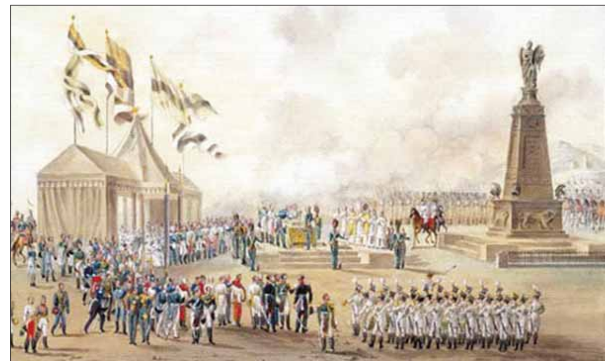
Б. Виганд. Закладка памятника русским воинам 17 (29) сентября 1835 года