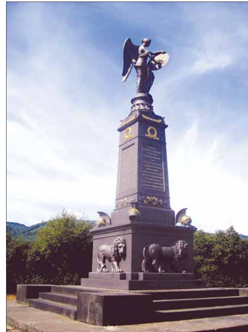
Пржестанов (бывший Пристен). Памятник русским воинам, сражавшимся при Кульме. 2013 год