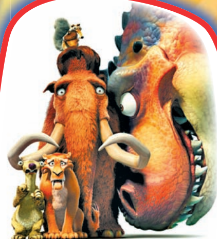
Ледниковый ПЕРИОД 3!