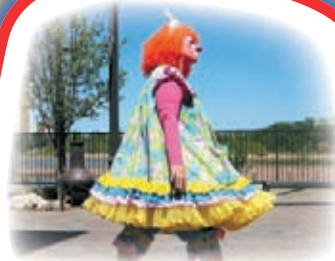
Клоуны, ЖОНГЛЁРЫ, акробаты