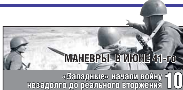
МАНЕВРЫ В ИЮНЕ 41-го

Проблемы воздушных операций Пентагона и ЦРУ 09