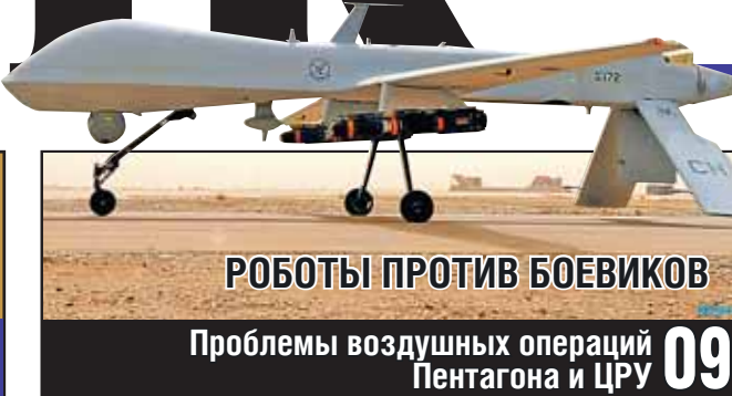
РОБОТЫ ПРОТИВ БОЕВИКОВ

Применим ли бизнес-подход для Минобороны РФ? 07