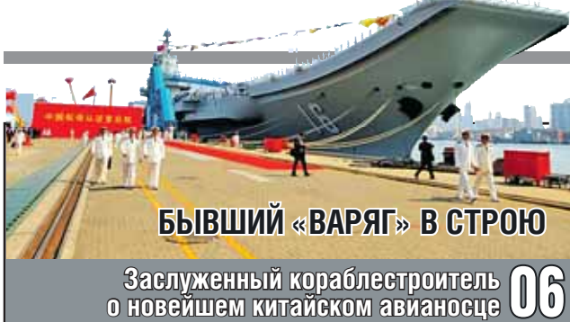
БЫВШИЙ «ВАРЯГ» В СТРОЮ

Заслуженный кораблестроитель о новейшем китайском авианосце 06