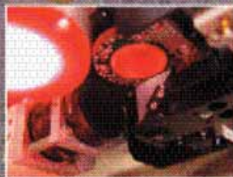
Новые технологии распознавания компонентов