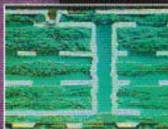
Варианты исполнения печатных плат с глухими и скрытыми отверстиями