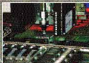
Автомат поверхностного монтажа SBA7100