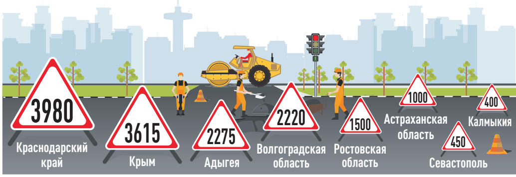
ИНФОГРАФИКА: ИГ. ИРИНА ТЕПЛОВА

Рыболовецкие предприятия, ведущие промысел в Азовском море, получают господдержку