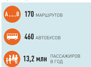
ИНФОГРАФИКА: «РТ-ЯКОВ ПИИНИН»