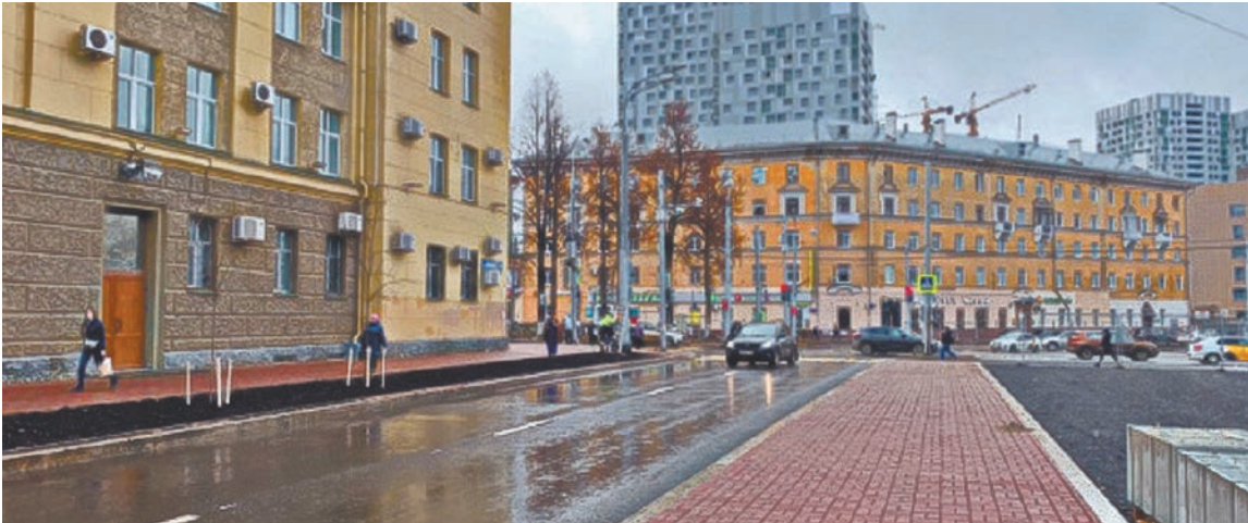
ПРЕСС-СЛУЖБА АДМИНИСТРАЦИИ ПЕРМИ

Как и было обещано, 15 октября в Перми на участке от Комсомольского проспекта до улицы Сибирской после ремонта открыли движение. В настоящий момент на перекрестке заканчивается настройка светофоров.