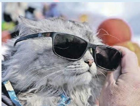
Олег УКЛАДОВ/«КП» - Барнаул

Августовский зной выйдет на пик в пятницу , предупреждают в Гидрометцентре России. Воздух раскалится до +31 градуса - это на 5 - 6 градусов выше, чем положено по климатическим нормам. При этом могут пройти короткие дожди, прогреют грозы. А потом жара пойдет на спад.