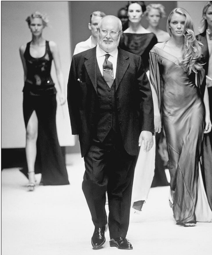
Джанфранко Ферре и его музы

— Что вы думаете о русских женщинах? Можно ли срав-