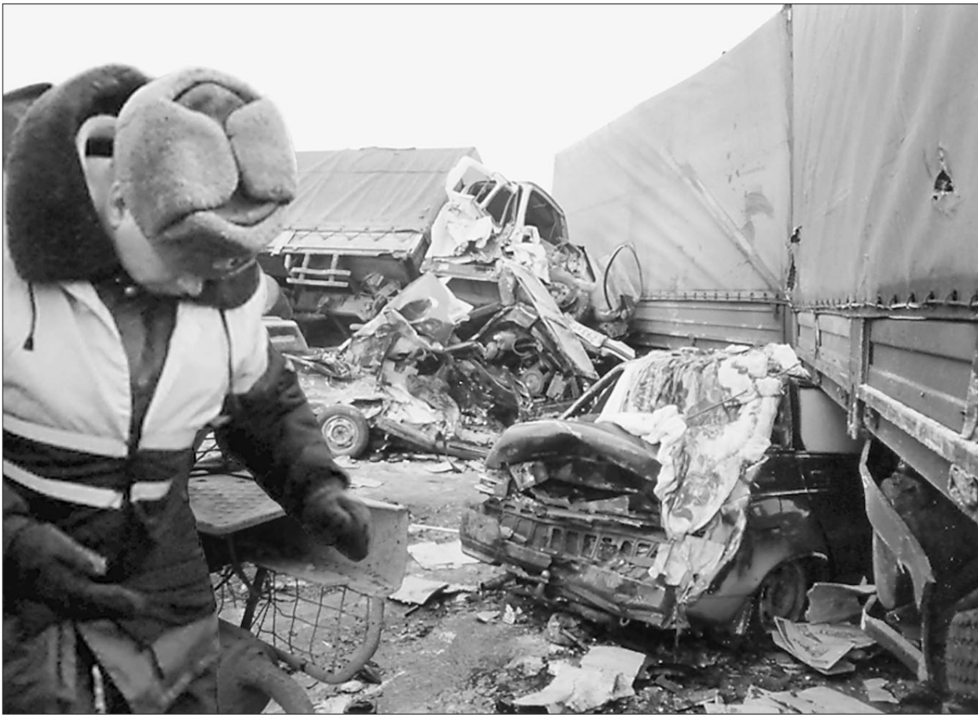
4 марта. Тульская область. На месте трагедии

Мы стоим на участке, который сотрудники ГИБДД перекрыли с двух сторон, направив машины во встречному полотну. На месте происшествия осталось около полутора десятков машин со следами страшных ударов. Чуть выше дежурит машина «Скорой помощи». Впрочем, пострадавших уже увезли в больницу. На асфальте осталась лужа крови, присыпанные песком, и разлитое масло. Сотрудники МЧС разрезают сплюсненные машины, эвакуаторы грузят на платформу «шестерку», которая от удара выгнулась в длину в два с лишним раза. Среди ошметков железа торчат куски мяса. Водитель «шестерки» вез говядину из Воронежа в Москву на продажу.