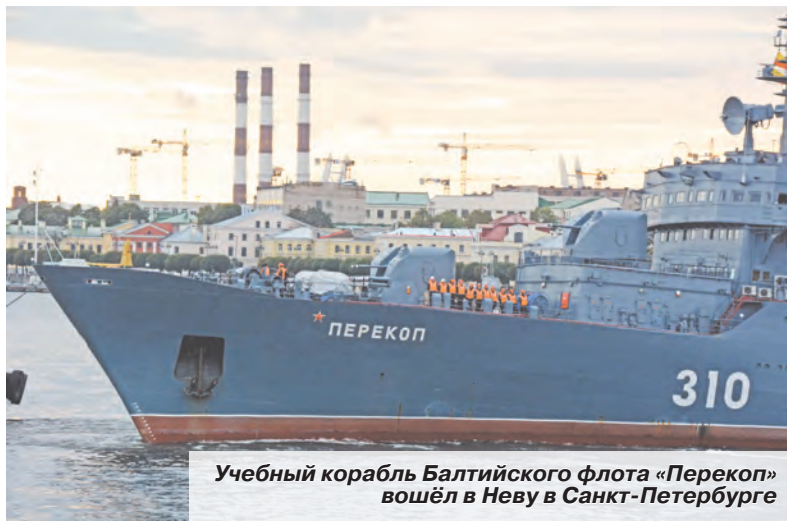
Учебный корабль Балтийского флота «Перекоп» вошёл в Неву в Санкт-Петербурге

Но этим праздничная программа не ограничится. В столице, к примеру, включили торжественную встречу в парке «Патриот» представителей Восточного военного округа, совершивших комбинированный переход из Хабаровска до Москвы. С 28 января они прошли с копией Знамени Победы почти 8,5 тысячи километров. Глава военного ведомства также рассказал, что в онлайн-проектах «Звонок ветерану» и «Открытка ветерану» принимают участие юнармейцы. И что 9 Мая во всех военных округах и на Северном флоте состоится возложение венков и цветов к воинским мемориалам.