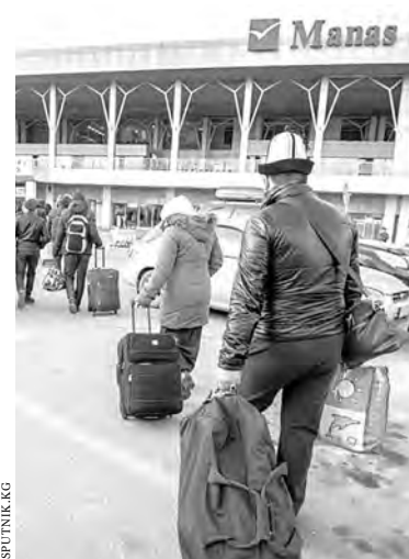
Граждане Киргизии могут вылететь в Россию только регулярными рейсами — в Москву.

Россия ограничивала воздушное сообщение с Киргизией в связи с угрозой распространения коронавирусной инфекции. В республике это привело к спекуляциям на авиабилетах и резкому росту цен на них. Правоохранительные органы Киргизии обвинили в этом местных туроператоров. Последние, как утверждают официальные источники, воспользовались большим спросом,кратно повысив стоимость билетов. Если ранее в Москву из Бишкека можно было улететь за 150 долларов, то в последние недели цена практически достигла 800.