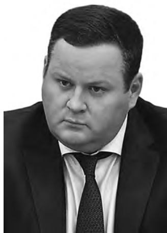
Антон Котяков, министр труда и социальной защиты РФ:

— По оценке Минтруда, сегодня более 2,4 миллиона россиян зарегистрированы как самозанятые. При этом почти 60 процентов молодых людей хотели бы работать на себя. По нашим прогнозам, к 2024 году количество самозанятых превысит пять миллионов человек, к 2030-му — приблизится к 10 — 11 миллион. В настоящее время ведомство прорабатывает варианты страхования для самозанятых, которые должны повысить их социальную защищенность.