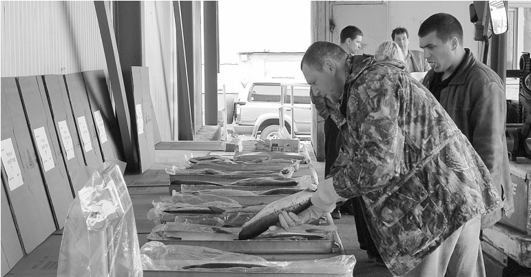
Рыбы на Дальнем Востоке много, но цены на нее кусаются из-за посредников.

В Приморье намерены снизить цены на рыбную продукцию за счет торговли без накруток на ярмарках выходного дня во всех муниципалитетах.