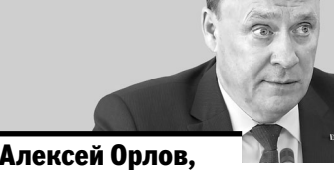
Алексей Орлов, первый замгубернатора Свердловской области