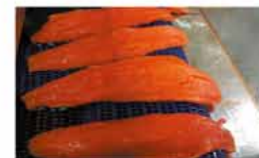
После инъектирования + 22% за один проход