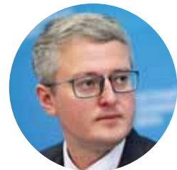
Владимир Солодов Врио губернатора Камчатского края