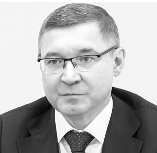
Владимир Якушев, полпред президента РФ в УрФО:

— Товарооборот между Россией и Беларусью в 2022 году вырос на 12 процентов. Во многом это обусловлено эффективным региональным сотрудничеством. Белорусские партнеры успешно заняли рыночные ниши, которые освободились после ухода ряда иностранных компаний, в частности, в пищевой и легкой промышленности. Важно не останавливаться на достигнутом. Мы заинтересованы в проектах и в других отраслях: фармацевтике, сельхозмашиностроении, танкостроении, микроэлектронике, химпроме.