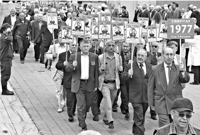
Многие офицеры СВВПТАУ погибли в горячих точках.