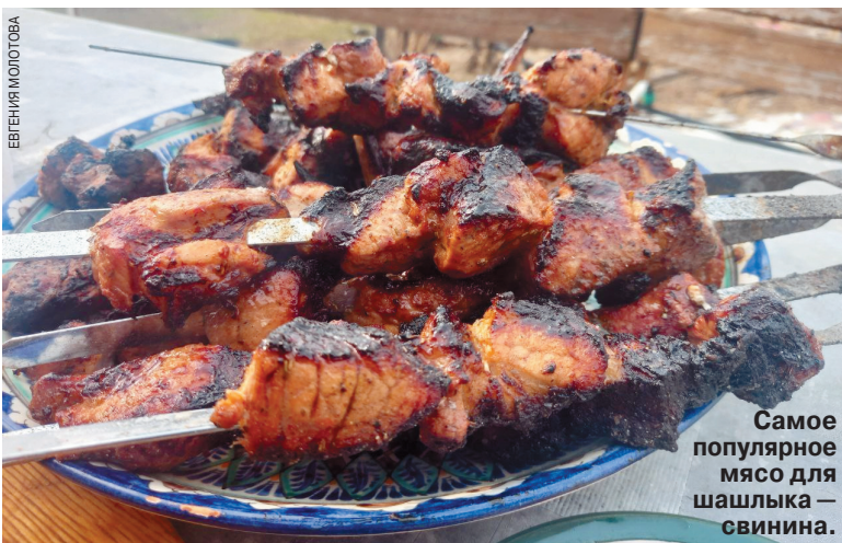
Самое популярное мясо для шашлыка — свинина.