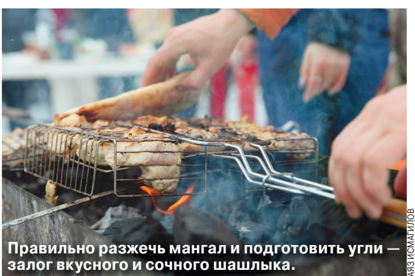
Правильно разрежь мангал и подготовь угли — залог вкусного и сочного шашлыка.