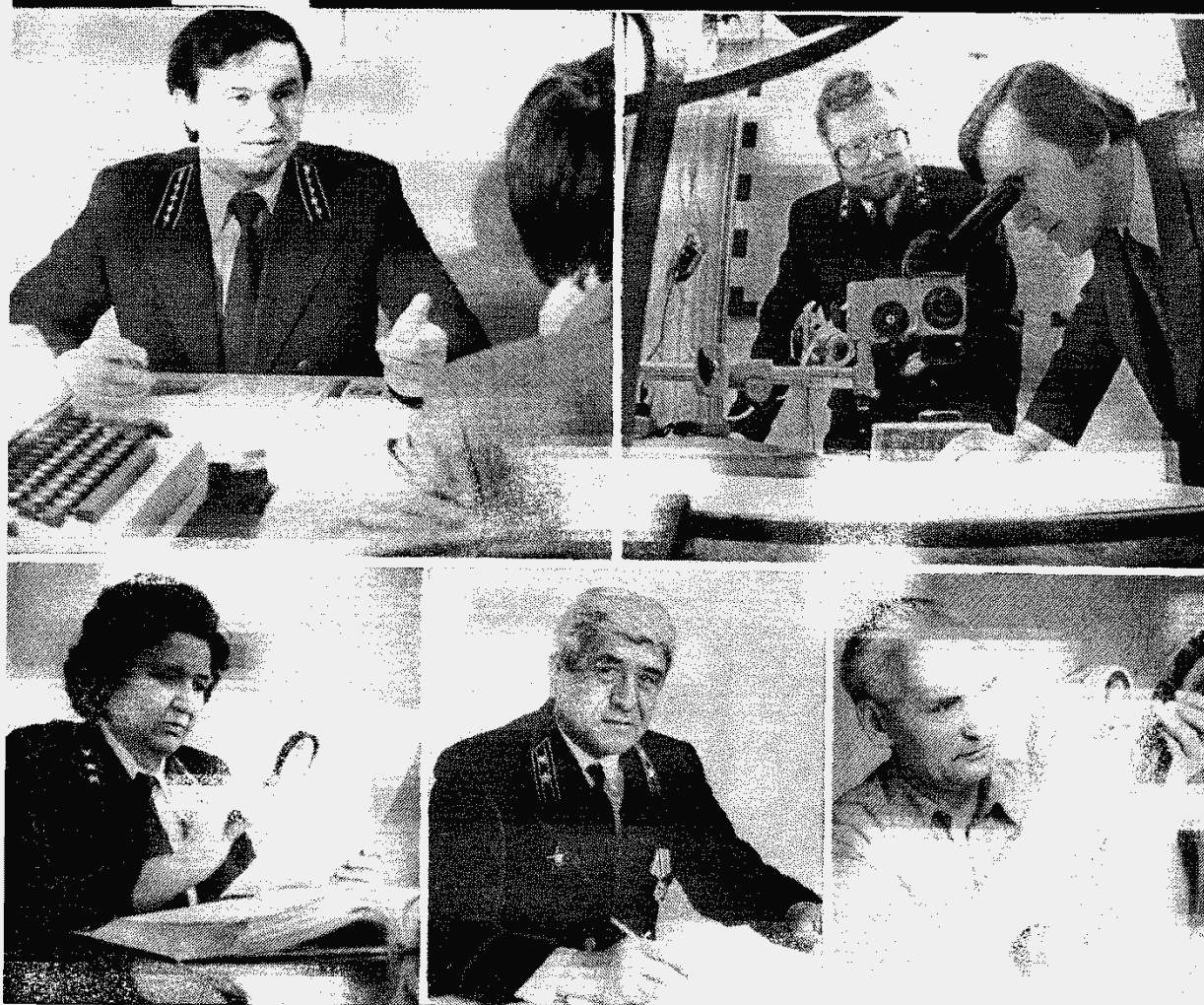
Следователи за работой