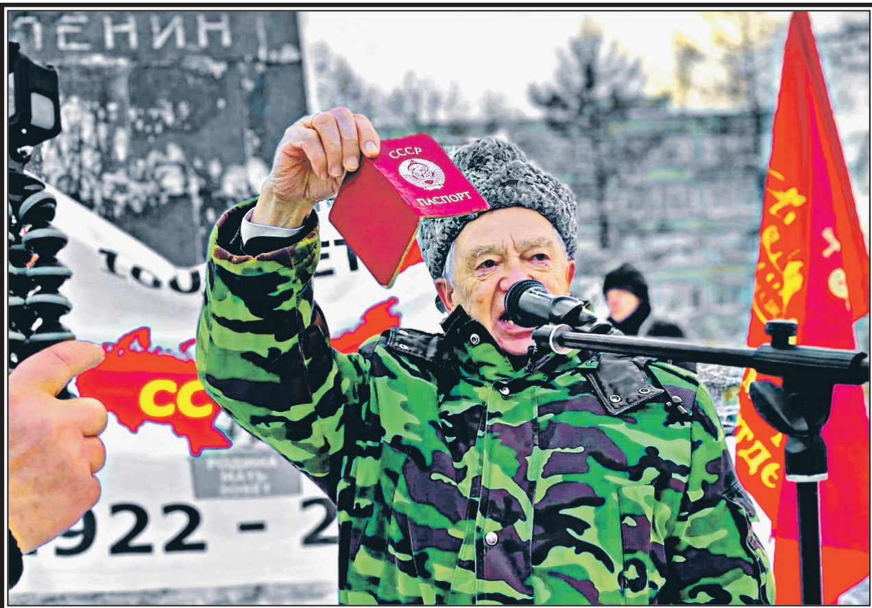
Геннадий ЗЮГАНОВ, председатель ЦК КПРФ