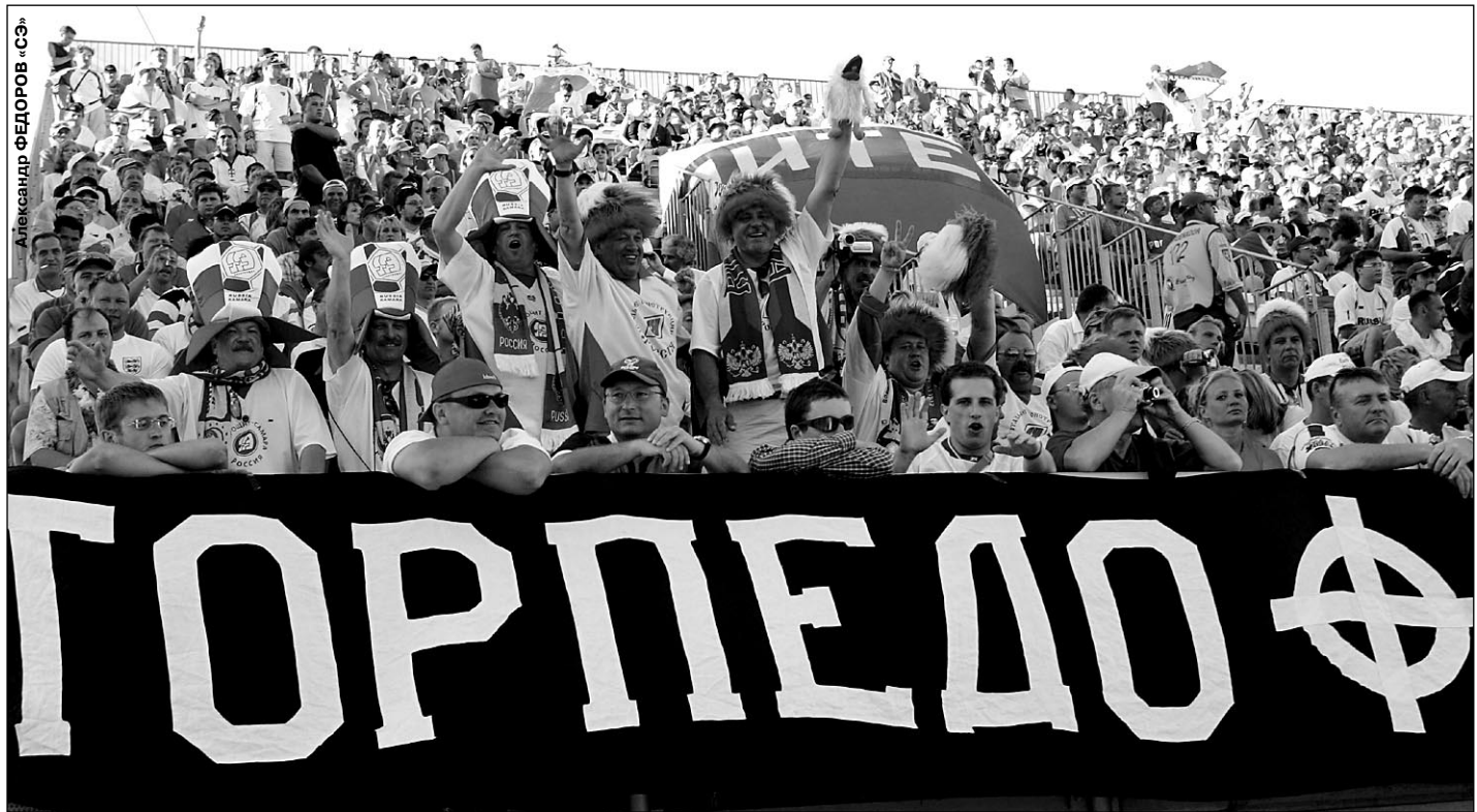
20 июня. Фару. Стадион «Алгарве». Россия - Греция - 2:1. Победа в этом матче не принесла России ничего. Уже на следующий день многие наши болельщики отправились домой - смотреть игры чемпионата страны, в котором лидирует московское «Торпедо».

О сегодняшних матчах чемпионата российской премьер-лиги - стр. 6