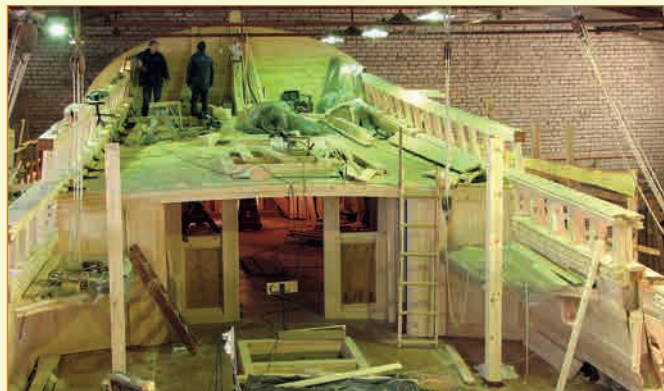
▼ Строительство полной ходовой копии первого линейного корабля русского флота «Гото Предестинация» в Петрозаводске ▲ 2013 г.