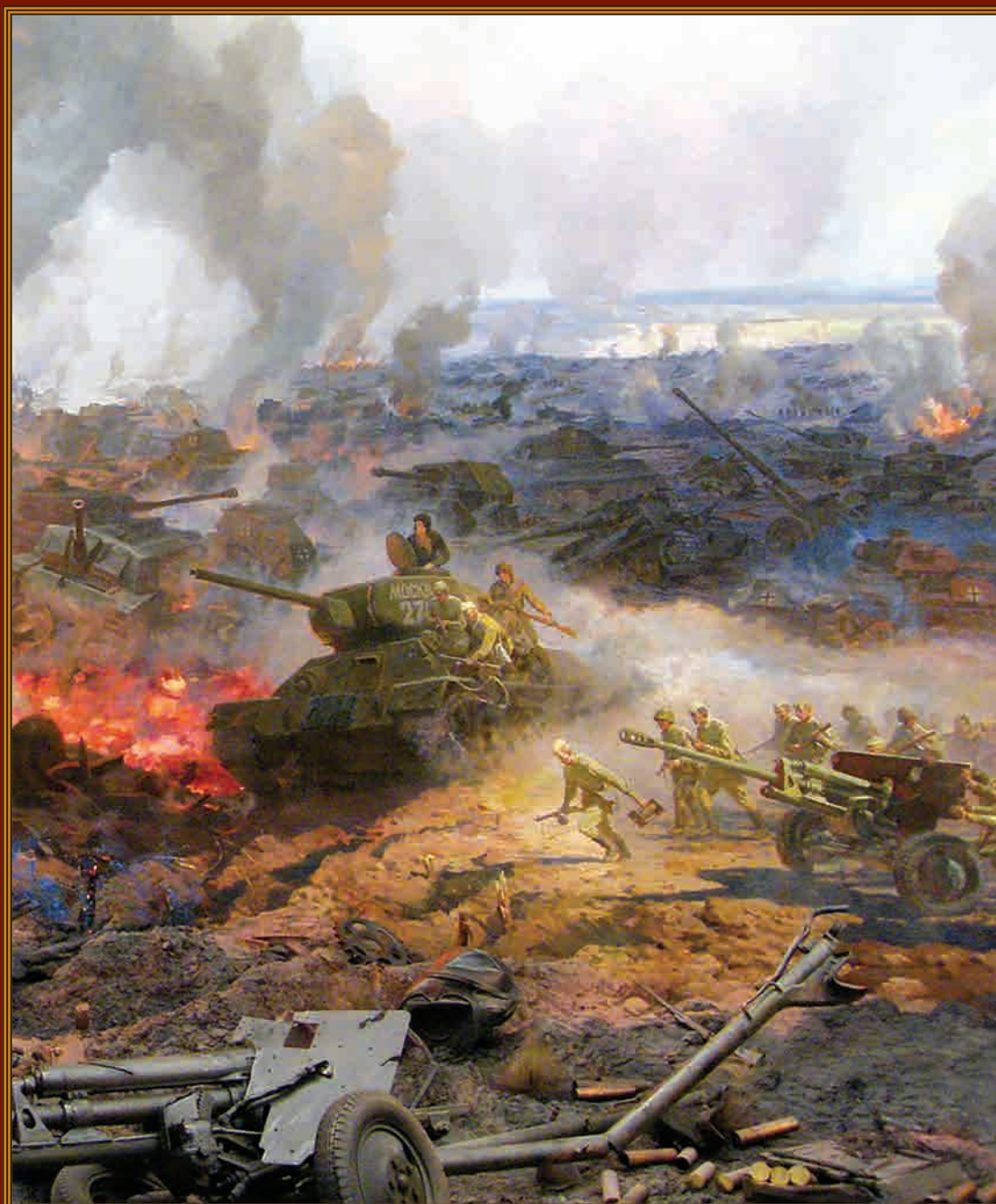
Фрагмент диорамы «Курская битва. Белгородское направление» Художники Н.Я. Бут, Г.К. Севостьянов, В.Н. Щербаков, М.А. Сычёв, г. Белгород

5 июля — 70 лет со дня начала Курской оборонительной операции в ходе Великой Отечественной войны