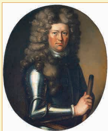
К. Крюйс Неизвестный художник, около 1709—1714 гг.

Подробнее об истории уникального корабля читайте в статье Г.А. Гребенщиковой «Вручение Петру ключей от турецкой земли».