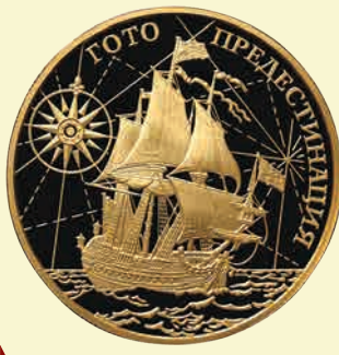
▲ Золотая монета «Корабль «Гото Предестинация»»