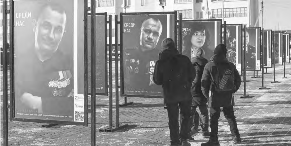
Портреты профессиональных спасателей, представителей силовых структур и правоохранительных органов, совершивших настоящие подвиги, спасая жизни, собрали в рамках одной фотовыставки с говорящим названием «Герои среди нас». Экспозицию посмотрели десятки тысяч белгородцев, а свое путешествие по городам и селам региона она продолжит в наступившем году.

В СМОЛЕНСКОЙ области возбудили уголовное дело о халатности со стороны чиновников администрации Руднянского района. Там 20-летняя девушка-сирота получила непригодную для проживания квартиру. Проблему выявили представители ОНФ. В СУ СКР по региону подтвердили, что в квартире отсутствовала вентиляция и нарушены нормы отопления, в связи с чем на стенах появился конденсат и образовался грибок.