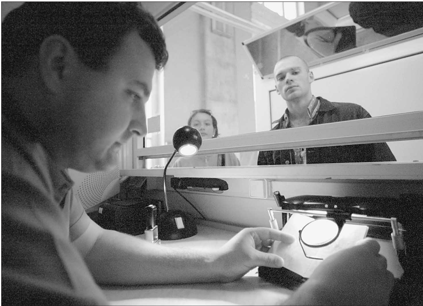
Враг не пройдет. Друг — тоже. (Проверка иностранного гражданина на границе Калининградской области)

● ЦИТАТА ДНЯ «Всегда приятно не прийти туда, где тебя ждут».