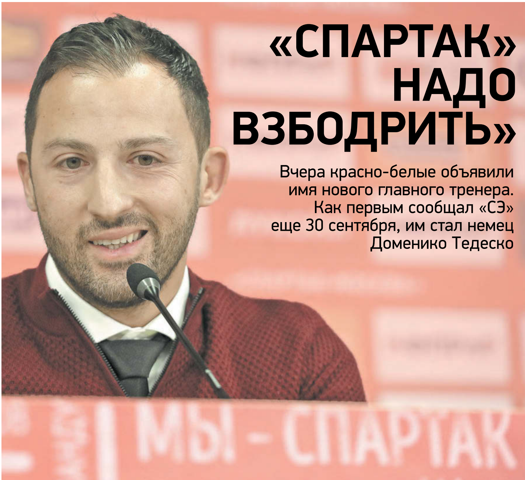
Вчера. Москва. Тушино. Новый главный тренер красно-белых Доменико Тедеско на своей первой пресс-конференции в московском клубе