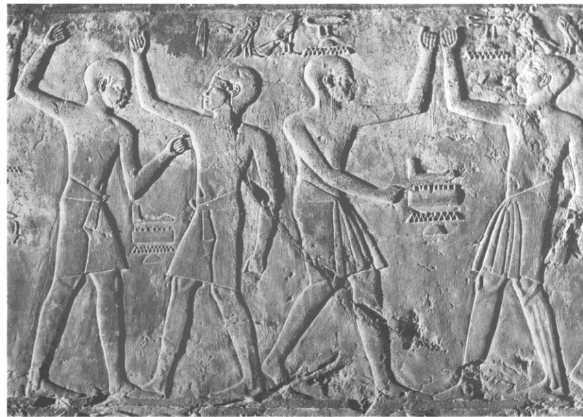
1. Фрагмент барельефа с изображением кулачных бойцов. Египет, 18 династия, 1370 г. до н. э.

Первоначально Олимпийские игры носили культовый характер и греки, считая их национальным праздником, придавали большое значение всестороннему воспитанию полной гармонии тела и духа.