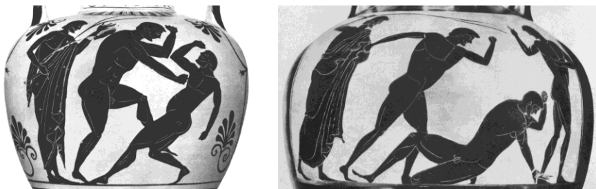
2, 3. Кулачный бой. Изображения на призовых амфорах VI – V вв. до н. э. из музеев Мюнхена и Берлина.

В древней Греции, готовясь к состязаниям, бойцы упражнялись в бою с тенью, с подобиями современной груши и боксёрского мешка. Древнегреческие философы Платон, Павсаний и Филострат очень подробно описывают тренировки и снаряжение боксёра. В снаряжение боксёра входил узкий длиной в 10 футов ремень, который по Павсанию якобы делался из недублёной пропитанной жиром воловьей кожи, что однако в настоящее время справедливо оспаривается специалистами. Узкий кожаный ремень с большим искусством несколько раз обматывался вокруг сгиба пальцев, шёл к запястью, оттуда наматывался до одной трети предплечья и там закреплялся. Пальцы оставались свободными, чтобы можно было сжать руку в кулак. Позднее бойцы выступали друг против друга с более утяжелёнными кулаками, оснащёнными во времена профессионального атлетизма даже ремнями для битья и с окантовкой на них из жёсткой кожи. Из всей силы бойцы осыпали друг друга ударами до тех пор, пока один не сдавался или обессилев не падал. Во многих сообщениях речь идёт о том, что отдельные бойцы избивались до неузнаваемости и что нередко им наносили и увечья.