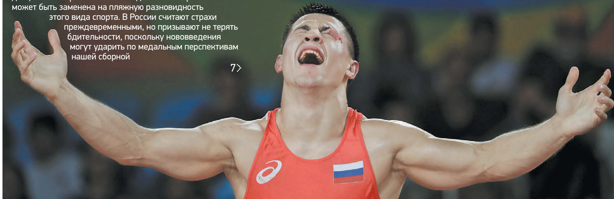
Двукратный олимпийский чемпион Роман Власов