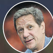
Александр Жуков, почетный президент ОКР

❖ Не думаю, что пляжная борьба может быть эквивалентом греко-римской. Это неправильно. Борьба – один из основных видов спорта, база, на которой возрождались Олимпийские игры. ❖