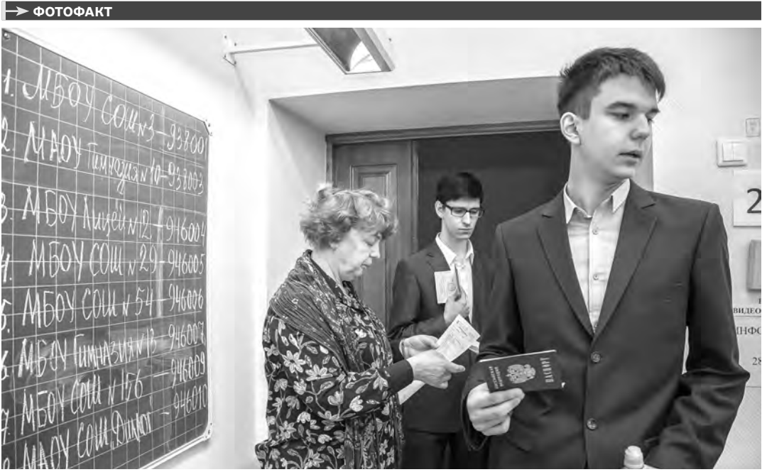
На этой неделе в школах начался основной период Единого государственного экзамена. Первые предметы— информатику и географию в Новосибирской области сдали около четырех тысяч ребят. А всего в этом году в регионе одиннадцатые классы окончили около 14 тысяч школьников.

В ОБРАЩЕНИЕ выпущены эксклюзивные марки с гербами Новосибирска и Новосибирской области. Тираж—45 тысяч экземпляров. После специального гашения на Главпочтамте несколько конвертов с марками передали в городской музей. К 125-летию сторлицы Сибири- пройдет еще одна акция— конкурс на лучший рисунок для создания почтовой открытки, посвященной юбилею города.