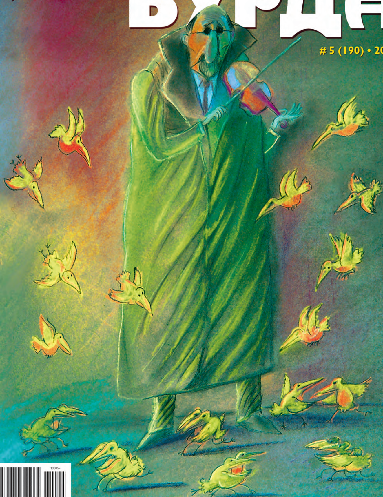
Рисунок Виктора Богорада