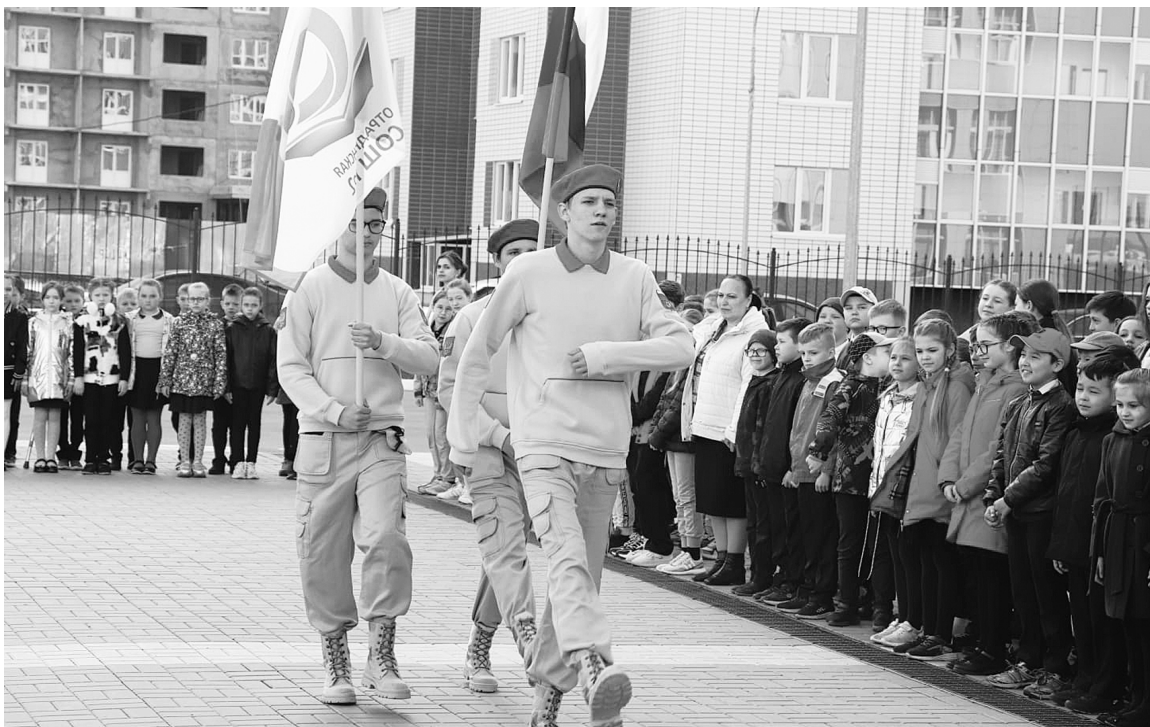
ДЕПАРТАМЕНТ ОБРАЗОВАНИЯ ВОРОНЕЖСКОЙ ОБЛАСТИ

Воронежская область стала одним из первых регионов, где ввели традицию поднятия флага и исполнения гимна Российской Федерации перед началом занятий в школах. Подобную церемонию теперь будут проводить в учебных заведениях региона каждую неделю. В торжественных линейках участвуют старшеклассники, отряды юнармейцев, активисты детских организаций и лучшие ученики школ.