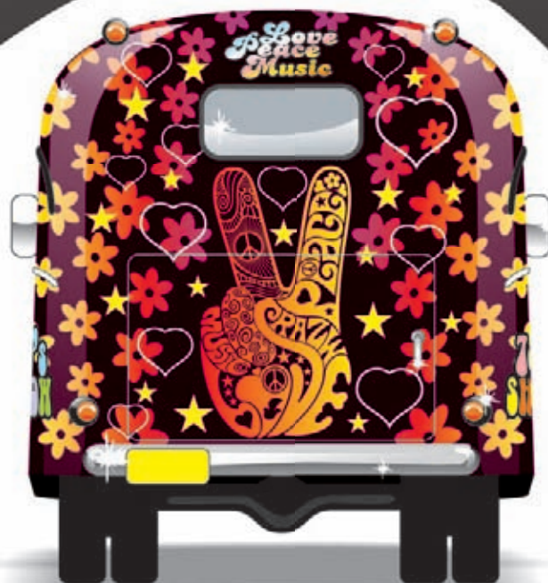
Иллюстрация Fabio Selani, Бразилия, создана в CorelDRAW®

До 30 апреля пользователям программных продуктов Quark Express, Xara Extreme Pro, Adobe Illustrator, Photoshop, Photoshop Extended или InDesign предоставляется скидка от 20% до 25% при покупке CorelDRAW Graphics Suite X6.