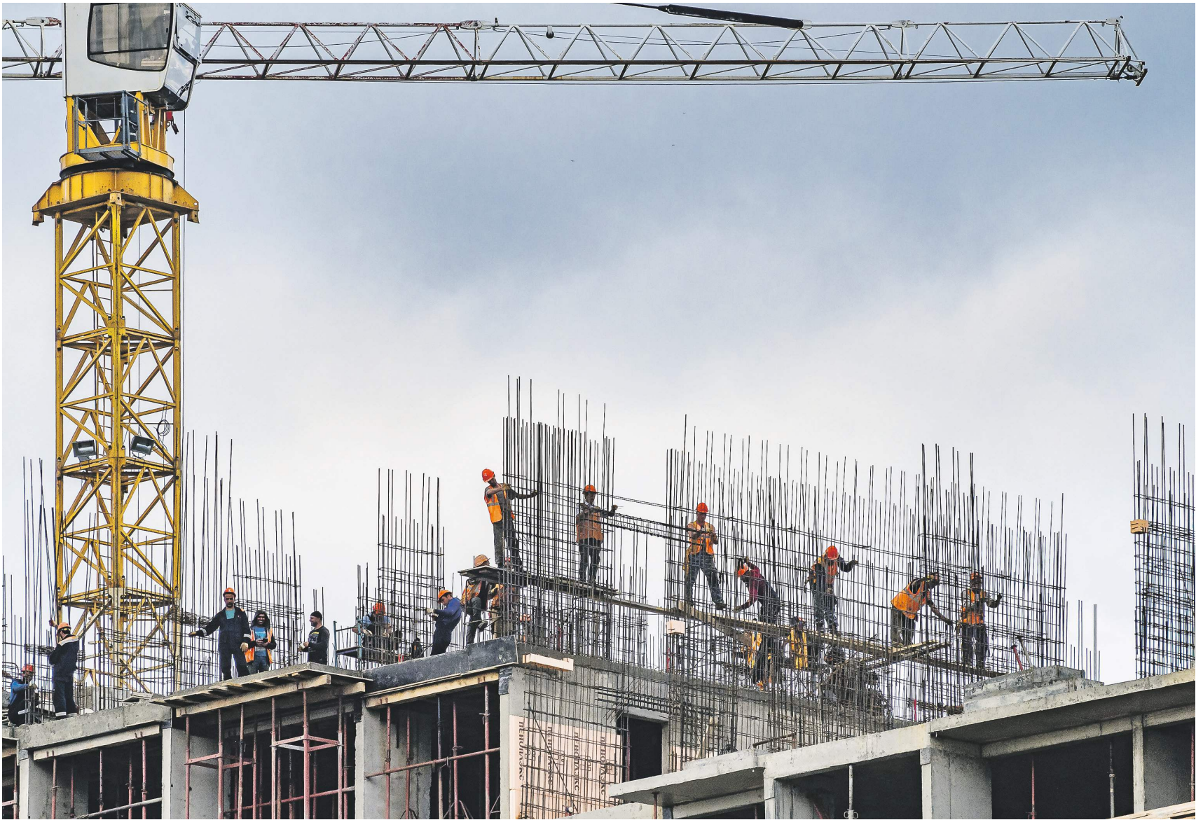
Константин Кошкин / Иллюстрация