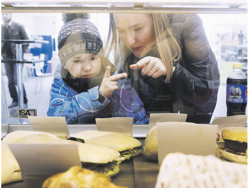
Алексей Майшев / «Известия»

Лучшую динамику показали кафе быстрого питания: с 30 декабря 2019 года по 8 января 2020-го средний чек там, по сравнению с аналогичным периодом прошлого года, вырос на 4%, составив 330 рублей. Продажи увеличились ещё больше — на 8%. Об этом свидетельствуют данные оператора фискальных данных «Такском», с которыми ознакомились «Известия». Компания обработала 17 млрд чеков, которые поступили с онлайн-касс российских магазинов. Также в праздничный период увеличился средний чек граждан в кофейнях — до 472 рублей, что на 5% выше предыдущего аналогичного сезона. Но продажи росли чуть медленнее — на 4%. В кафе средний чек был выше — 670 рублей (+4,3%), но рост продаж был незначительным — 1,2%. А в ресторанах продажи выросли на 2%, хотя средний чек вырос на 1,6% — до 1,6 тыс. рублей.