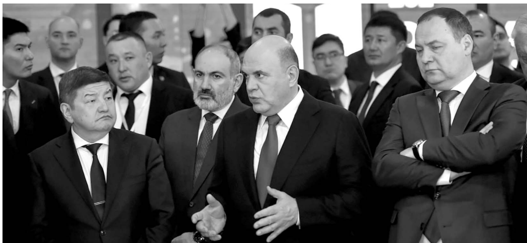
ПРЕСС-СЛУЖБА ПРАВИТЕЛЬСТВА КР

Использование новых технологий позволит удешевить товары в ЕАЭС