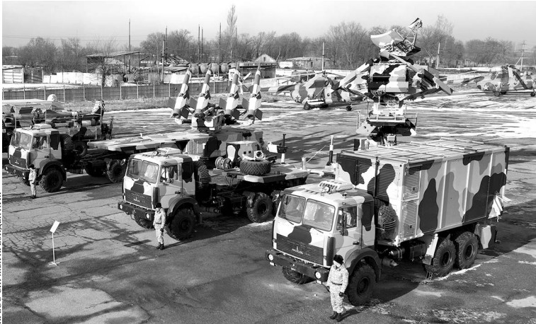
ПРЕСС-СЛУЖБА ПРЕЗИДЕНТА КР