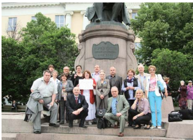
Что нам 30, если журфаку – 60!