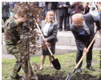
Сегодня – клен, но раньше был – ясень