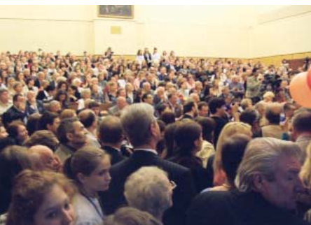
Такой посещаемости известная аудитория не припомнит...