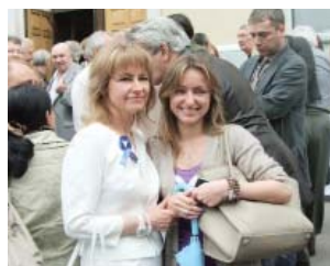
Журфак: родители, дети, будут внуки потом