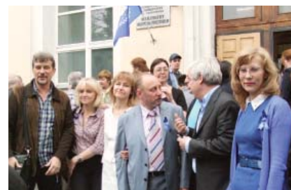
Мы снова вместе!