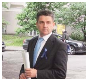
Их знают в лицо не только на журфаке