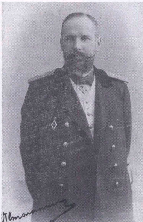
Петр Аркадьевич СТОЛЫПИН (1862 – 1911)

ЕЖЕМЕСЯЧНЫЙ ОБЩЕСТВЕННО-ПОЛИТИЧЕСКИЙ ЖУРНАЛ