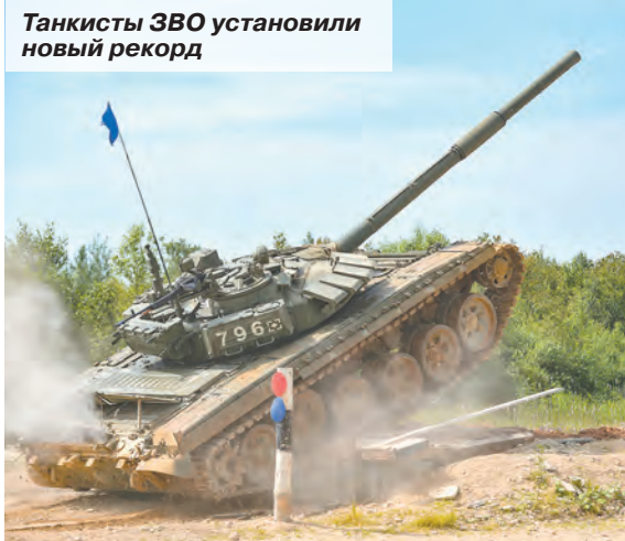
Танкисты ЗВО установили новый рекорд

Всего в конкурсе принимали участие семь команд: от четырёх военных округов, Казанского высшего танкового командного училища, Дальневосточного высшего общевойскового командного училища и ВДВ. При проведении практической части состязаний участники последовательно прошли четыре этапа: «Выполнение танковыми взводами огневых задач в ходе преодоления маршрута с естественными и искусственными препятствиями»; «Выполнение танковыми взводами учебно-боевых задач»; «Спортивный»; «Эстафета танковых взводов».