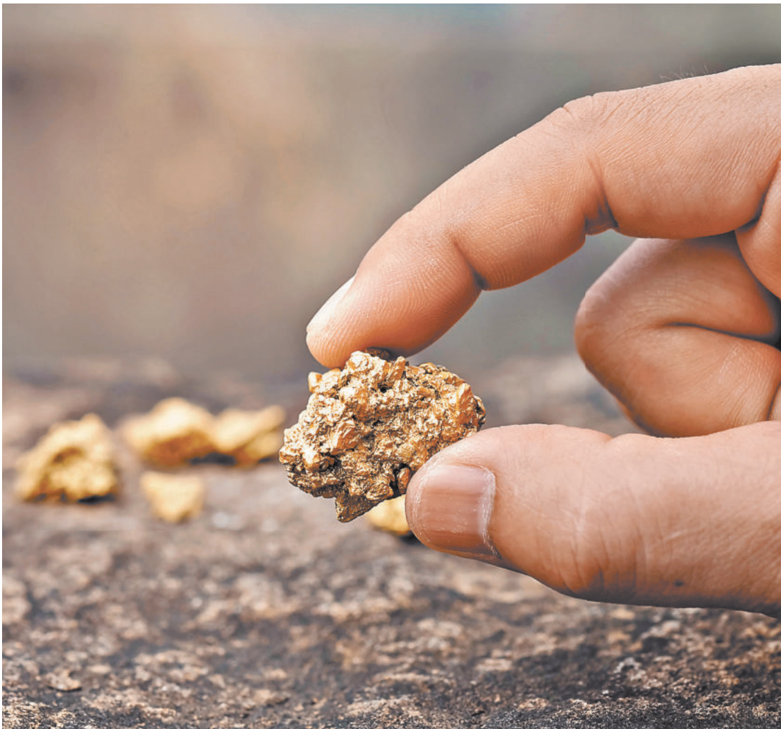
Мерные слитки для инвесторов Гознак делает из максимально чистого золота: пробы 999,9. Добывается оно, естественно, в России.

Цена слитка меняется ежедневно и зависит от биржевых котировок. В целом текущая стоимость слитка в 10 граммов — выше 50 тыс. рублей (накануне он продавался по цене 53 919 рубля), слиток в 20 граммов стоит, соответственно, ровно в два раза дороже. Заплатить за слиток можно только картой, не наличными.