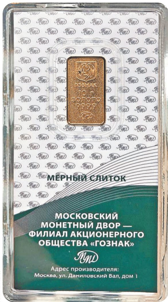
Мерные слитки для инвесторов Гознак делает из максимально чистого золота: пробы 999,9. Добывается оно, естественно, в России.