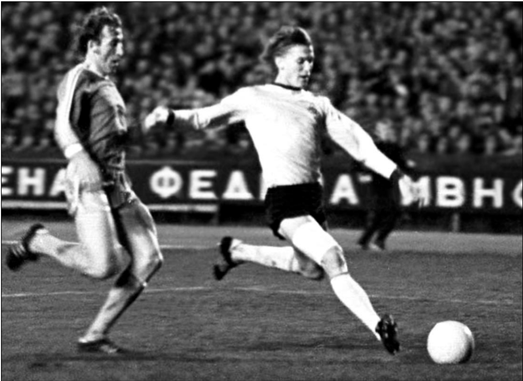
6 октября 1975 года. Киев. Суперкубок Европы. «Динамо» К - «Бавария» - 2:0. Олег БЛОХИН забивает один из своих двух голов в ворота гостей из ФРГ. На этот раз голкипер Зепп МАЙЕР сумел помешать мячу влететь в ворота.

Осенью 1975 года наш клуб впервые получил мировую славу. После победы над «Баварией» в Суперкубке Европы о киевском «Динамо» и советском футболе заговорили в полный голос. Спустя 24 года нас вновь ждет противостояние двух суперкоманд.