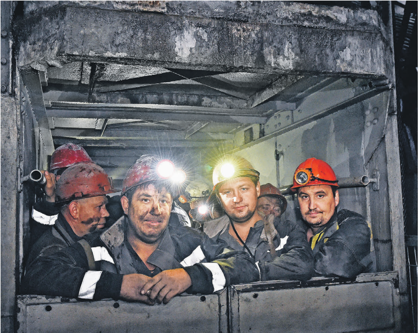
Угольная отрасль приветствует новые меры поддержки