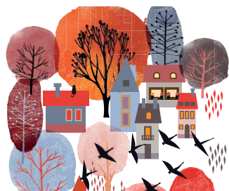
Рисунок на обложке: Shutterstock.com

ПРИЗ ЗА ПОДПИСКУ 10 подарков для первых подписавшихся в ноябре