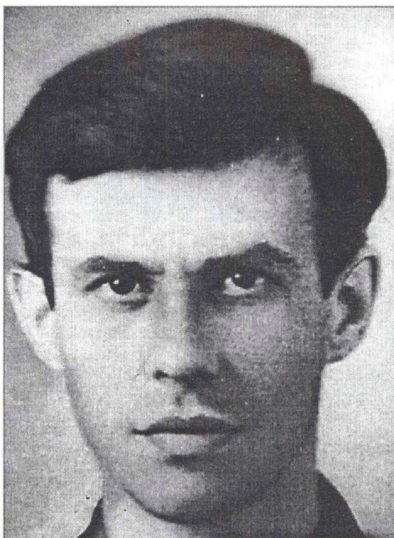
ЮРИЙ ГАЛАНСКОВ (1939-1972)