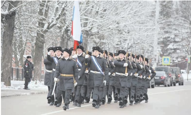
Торжественный марш роты почётного караула у памятника 1200 гвардейцам.

Для ознакомления участников сбора с современными образцами военной техники и специальных средств, стоящих на вооружении воинских частей и подразделений Балтийского флота, на территории профессионально-технической комиссии БФ развёрнута выставка.