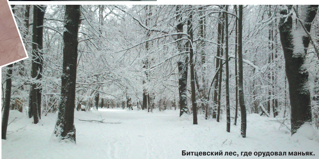
Битцевский лес, где орудовал маньяк.