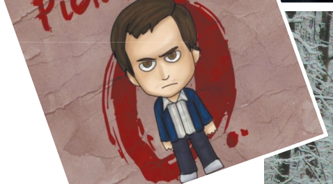
Это самая невинная картинка со страницы фанатов Пичушкина.