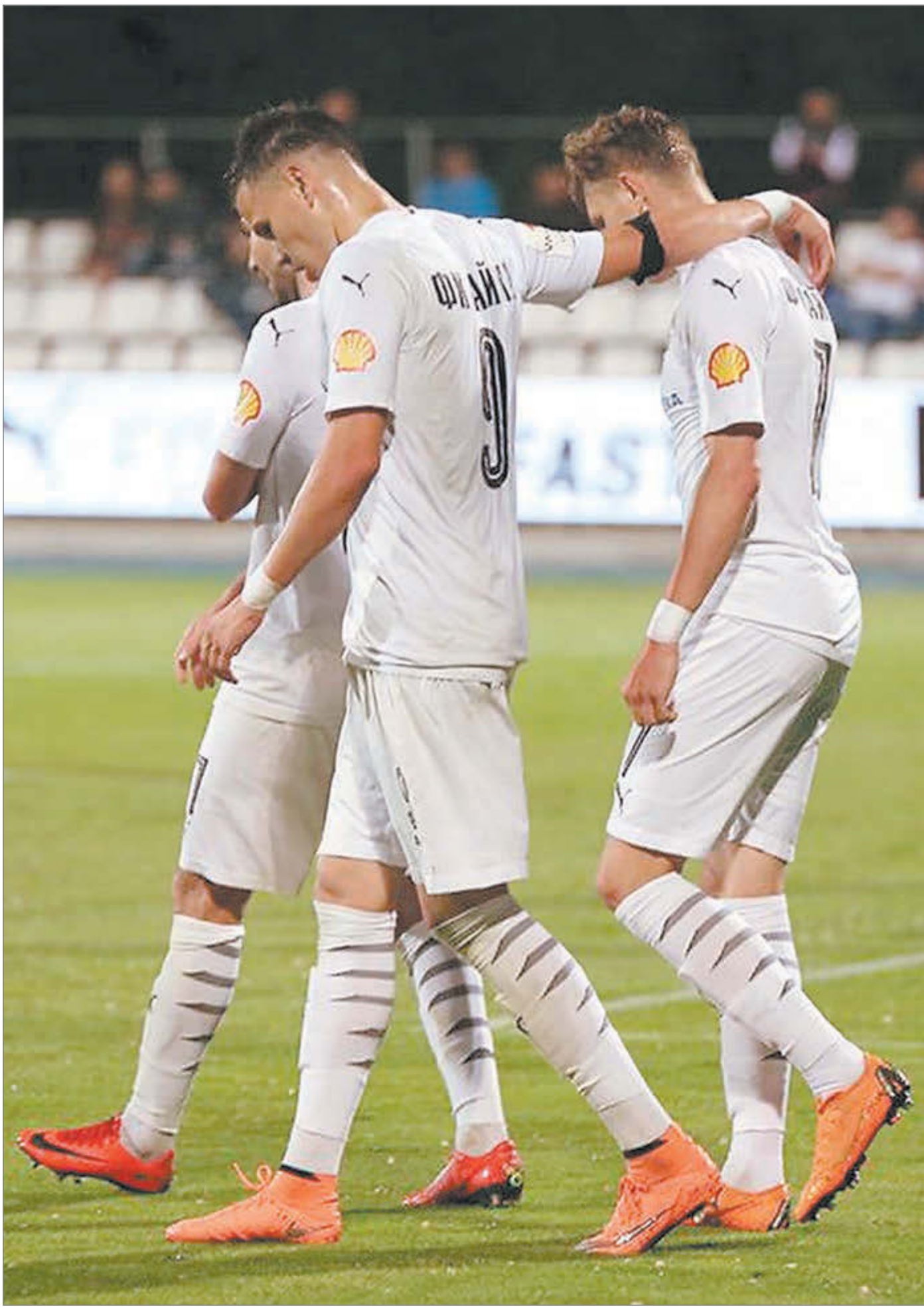
13 мая. Песчанокоское. «Чайка» - «Черноморец» - 3:1. В этом матче хозяева одержали победу. Но была ли она честной?