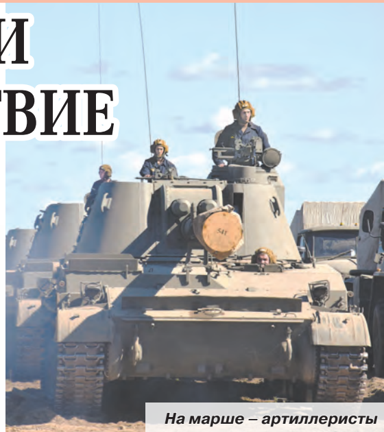
На марше – артиллеристы

На территории полигона Кирилловский общевойсковой армии ЗВО более 3,5 тысяч военнослужащих Красносельской и Севастопольской отдельных гвардейских мотострелковых бригад приняли участие в двухстороннем тактическом учении.