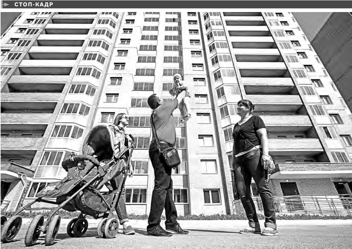
Семье Юнусовых из города-спутника Екатеринбурга Березовского вручили ключи от квартиры в одном из трехдомов жилого комплекса «Березки». Вместе с ними новоселье справят еще 69 семей. Строительство ЖК началось в 2013 году. Первую многоэтажку сдали в срок. Квартиры во втором доме жильцы получили после трех лет ожидания, в третьем — более четырех. За шесть месяцев 2018 года в регионе решены проблемы 377 дольщиков, а с 2012 года жильем обеспечены свыше четырех тысяч уральцев, признанных пострадавшими от действий недобросовестных застройщиков.

ДЛЯ ОРГАНИЗАЦИИ обучения детей в одну смену в регионе создадут пять тысяч мест. Одним из первых муниципалитетов, где занятия во всех школах будут начинаться утром, станет Кировград. В городе 1 сентября откроется новая школа на 1,2 тысячи учащихся. Это пятое образовательное учреждение, возведенное в Свердловской области по федеральной программе перевода детей на односменный режим обучения.