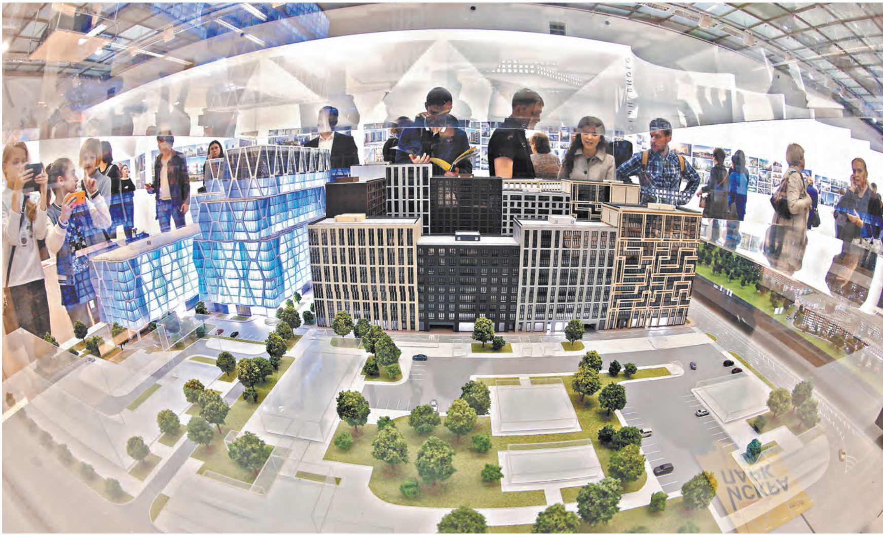
Стоимость строительства можно уменьшить минимум на 8%, считает Владимир Якушев.